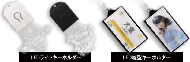
LEDライトキーホルダー

LED箱型キーホルダーは8つの白色LEDが絵柄を明るく魅せます。全面にフルカラー印刷が可能なので、キャラや人物はもちろんレトロな光る看板のような趣のあるデザインにもおすすめです。