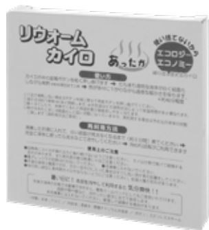
通常パッケージ：白箱 (説明書きあり)