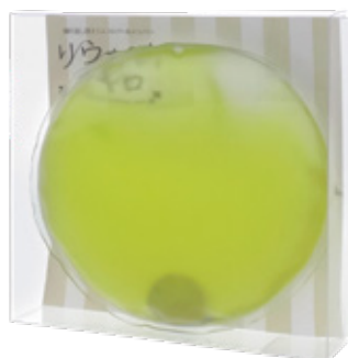
台紙・クリアパッケージ入りも可 サイズW100×H100×D20mm