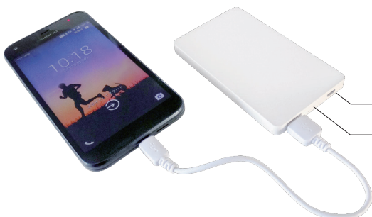
本器への充電用挿し込み口 バッテリー残量インジケータ (点滅回数で残量を4段階でLED表示)