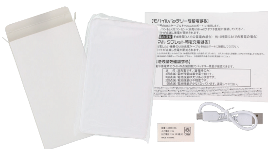
包装仕様 本体は透明袋に入れて白箱入り チャック付透明袋に白箱・説明書・ケーブル入り