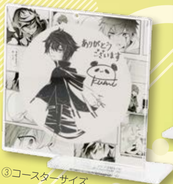
③コースターサイズ