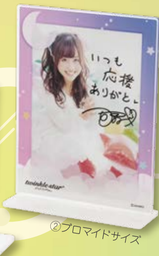
②プロマイドサイズ